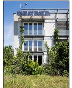
Das weltweit erste Passivhaus in Darmstadt-Kranichstein.

Mail: presse@passiv.de / Tel: 06151 / 826 99-25