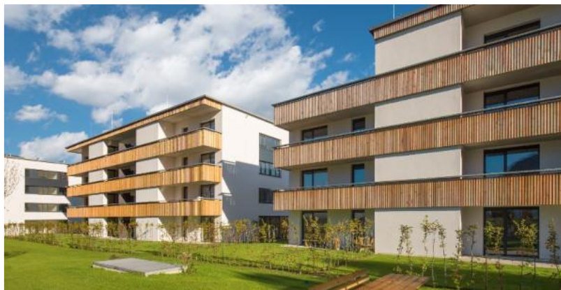
Energieeffizient und kostengünstig: Sozialer Wohnungsbau der Baugesellschaft Neue Heimat Tirol in Kufstein.