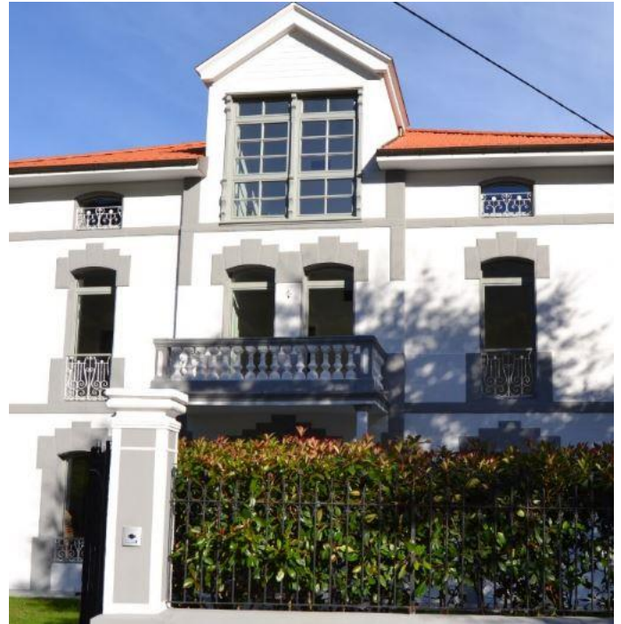
Die energieeffiziente Sanierung dieses Hotels in Spanien wird auf der Passivhaustagung vorgestellt.