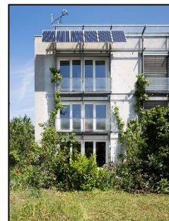
Das weltweit erste Passivhaus in Darmstadt-Kranichstein.

In einem Passivhaus hält sich die Wärme 10 bis 14 Tage lang, da sie nur sehr langsam entweicht. Daher muss nur an sehr kalten Tagen aktiv geheizt werden. Insgesamt ist nur wenig Energie für die Bereitstellung dieser Restwärme vonnöten. Im Sommer (sowie in warmen Klimaten) ist ein Passivhaus ebenfalls im Vorteil: Dann bewirkt u.a. die gute Dämmung, dass die Hitze draußen bleibt. Eine aktive Kühlung ist daher in Wohngebäuden in der Regel nicht nötig. Durch die niedrigen Energiekosten sind die Nebenkosten kalkulierbar - eine Grundlage für bezahlbares Wohnen und sozialen Wohnungsbau. Ein Passivhaus verbraucht rund 90 Prozent weniger Heizwärme als ein bestehendes Gebäude und 75 Prozent weniger als ein durchschnittlicher Neubau.