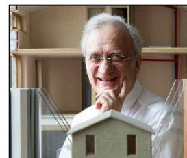
Dr. Wolfgang Feist

Mittlerweile gibt es Passivhäuser für alle Nutzungsarten: Neben Wohn- und Bürogebäuden existieren auch Kitas und Schulen, Sporthallen, Schwimmbäder und Fabriken als Passivhäuser. In Frankfurt am Main entsteht gerade die weltweit erste Passivhaus-Klinik. Das Interesse steigt stetig. Mit Blick auf den Ressourcenverbrauch der Industrieländer sowie den Klimaschutz realisieren Kommunen, Unternehmen und Privatleute einen Neubau oder eine Sanierung zunehmend im Passivhaus-Standard.