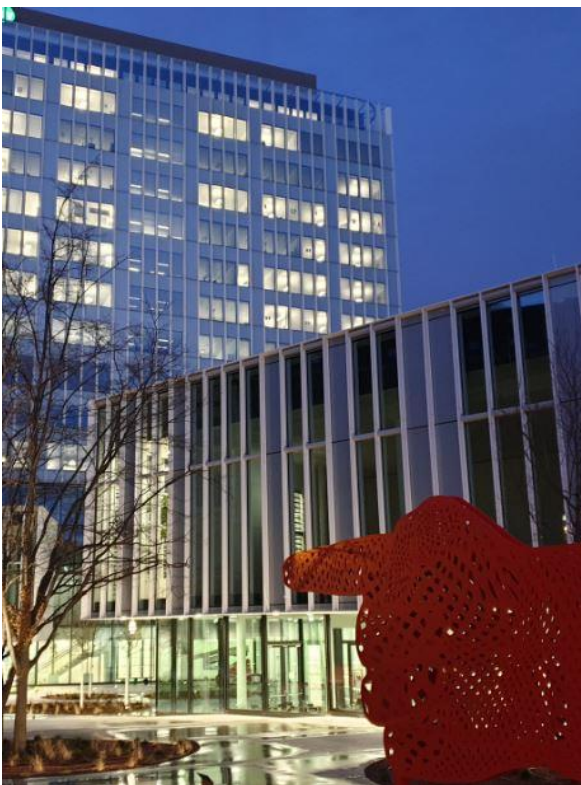
Vortragsreihe 11 der Tagung behandelt mehrschossige Passivhäuser, darunter auch die Sanierung dieses Bürogebäudes in Wien.