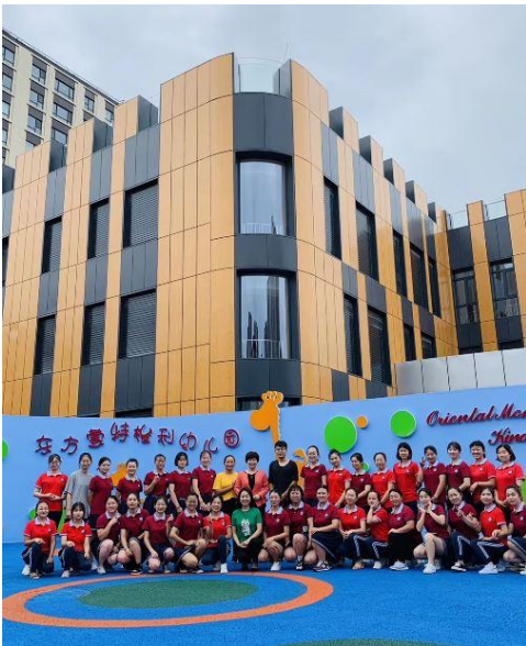
Bei der 24. Internationalen Passivhauskonferenz werden u.a. weltweite Projekte vorgestellt, darunter der Passivhaus-Kindergarten X88 in Peking für über 600 Kinder.

Die 24. Internationale Passivhaustagung steht unter dem Leitmotto „ Passivhaus – Nachhaltig die Zukunft bauen “. Nach der Eröffnung werden über drei Wochen hinweg jeweils mittwochs und donnerstags die Online-Fachvorträge zum klimafreundlichen Bauen und Sanieren im Passivhaus-Standard gehalten. Die Teilnehmer haben so die Möglichkeit, mehreren Vortragsreihen beizuwohnen. Diese finden am Vormittag sowie am Nachmittag (CEST) in zwei parallelen Sessions statt. Die Vorträge werden in Deutsch und Englisch gehalten. „Mit der Online-Tagung nutzen wir den Vorteil, über drei Wochen Programm anbieten zu können. Es werden beeindruckende Neubau- und Sanierungsprojekte vorgestellt, darunter zahlreiche Passivhäuser, die mit der Erzeugung erneuerbarer Energie verbunden sind. Alle Projekte beweisen, dass es möglich ist, Nachhaltigkeitskriterien zu folgen“, erklärt Jan Steiger, Mitglied der Geschäftsführung des Passivhaus Instituts.