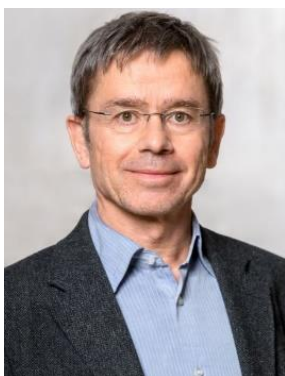
Der Klimaforscher und Autor Prof. Stefan Rahmstorf spricht zur Eröffnung.

Darmstadt. Die Anmeldung für die 24. Internationalen Passivhaustagung mit dem Leitmotto „Passivhaus – Nachhaltig die Zukunft bauen“ ist freigeschaltet. Im Eröffnungsplenum der Tagung, die am 20. September 2020 beginnt und zum ersten Mal als Online-Veranstaltung angeboten wird, hält auch der Klimaforscher Professor Stefan Rahmstorf einen Vortrag. Anschließend finden über drei Wochen an jeweils zwei Tagen pro Woche Fachvorträge statt. Die Tagung endet am 8. Oktober 2020. Das Online-Format bietet die Möglichkeit, auch die Passivhaus-Fachausstellung für drei Wochen zu öffnen. Exkursionen zu interessanten Passivhaus-Projekten werden ebenfalls digital ermöglicht. Das detaillierte Programm ist auf der Tagungswebseite veröffentlicht. Der Frühbucherrabatt gilt bis zum 10. August 2020.