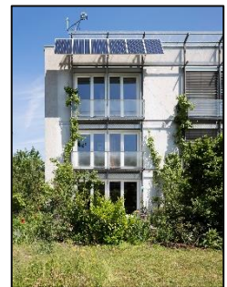
Das weltweit erste Passivhaus in Darmstadt-Kranichstein.